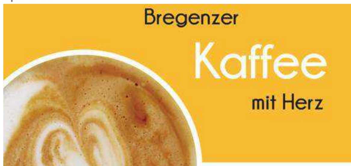
Bregenzer Kaffee mit Herz, eine Spende der GUTA Bregenz

Herzlichen Dank für eure wertvolle Unterstützung, Konsumation, Spende!